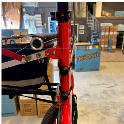
⑥ De to holdere er korrekt monteret på rammerøret.