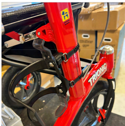
⑧ Flaskeholderen er nu fastgjort til rammen, og du sætter flasken ind fra siden og fjerner den udad.