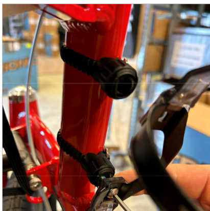
⑦ Fastgør flaskeholderen med de to skruer. Flaskeholderens "åbning" skal vende udad.