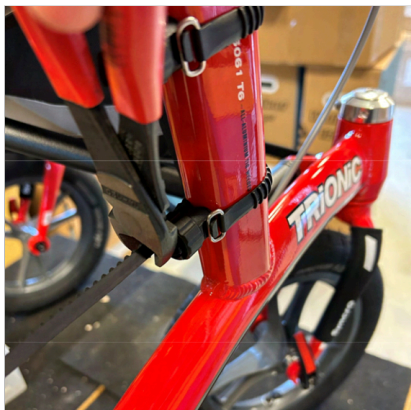
⑤ Monter den anden holder på samme måde.